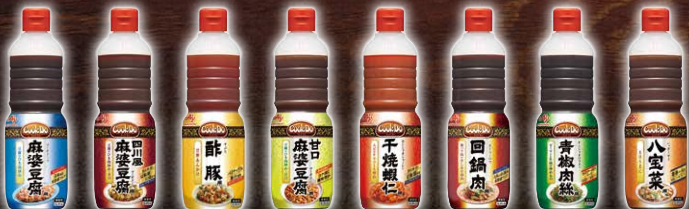
「Cook Do®」 麻婆豆腐用 四川風麻婆豆腐用 酢豚用 甘口麻婆豆腐用 干焼蝦仁用 回鍋肉用 青椒肉絲用 八宝菜用