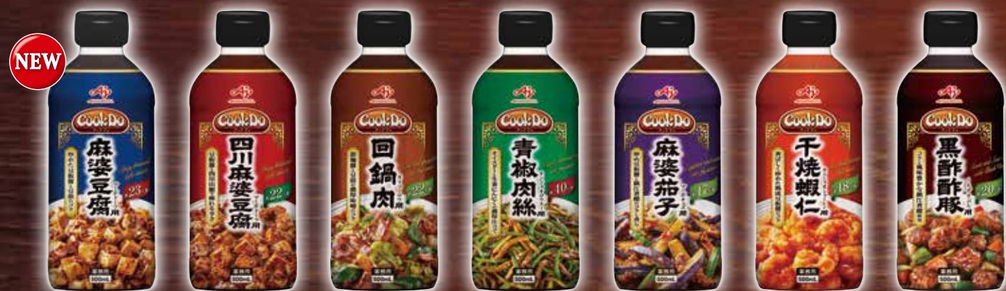
「Cook Do®」 麻婆豆腐用 四川麻婆豆腐用 回鍋肉用 青椒肉絲用 麻婆茄子用 干焼蝦仁用 黒酢豚用