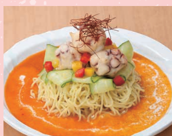
タコフリット冷し担々麺