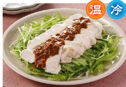
蒸し鶏の担々ソースがけ