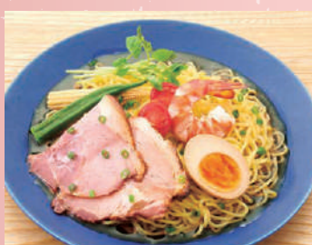
彩り冷しラーメン