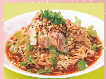
よだれ鶏の冷し麻辣麺